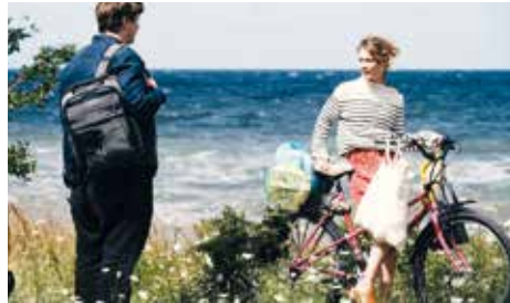
Der neue Film von Christian Petzold (Barba-

ROTER HIMMEL (Start 20.4.) HH-Premiere mit Regisseur Christian Petzold und weiteren Gästen am Mi., 19.4. um 20:00h / So., 23.4. um 11:00h / Mo., 24.4. um 17:30h