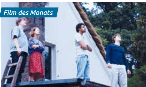
Film des Monats

HH-Premiere mit Regisseur Christian Petzold und weiteren Gästen am Mi., 19.4. um 20:00h / So., 23.4. um 11:00h / Mo., 24.4. um 17:30h