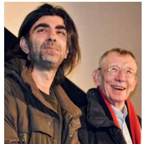
Regisseur Fatih Akin und Schauspieler Hark Bohm zu „Der goldene Handschuh“ 25. Februar