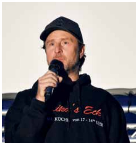
Hauptdarsteller Bjarne Mädel mit guter Laune in unserem zeise open air zu „25 km/h“ am 11. Juli